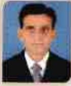
ડૉ. કનુભાઈ પી. પટેલ સાયન્સ કોલેજ