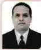
ડૉ. પ્રદીપ એન. જયસાગ ઈન્જીનિયરીંગ મીડીયમ સ્કૂલ (માધ્યમિક)