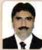
ડૉ. હિમતભાઈ ડી. પટેલ એજ્યુકેશન કોલેજ