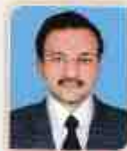
શ્રી દિપક એન. મેઠી ઈન્જીનિયરીંગ મીડીયમ સ્કૂલ (પ્રાથમિક)