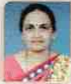
શ્રીમતી ગીતાબેન ઠી. મિનામ ડી.એલ.એડ્.કોલેજ