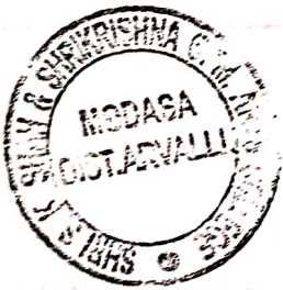
SHRI S.K. SHAH & SHRI KRISHNA O.M. ARTS COLLEGE, MODASA

प्राप्त डेटा से हमे यह पता चलता है की सभी स्टूडेंट में चाहे वह लड़किया है या लड़के उनका नैतिकता का जो अंक है वह बेर्लेस है । किसी को भी नैतिकता के मामले में काउंसलिंग की जरूरत नहीं है।